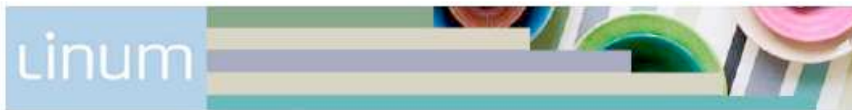
Bannière horizontale 728x90